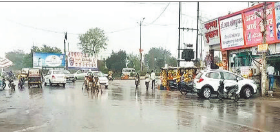
बारिश होने के बाद सड़क का नजारा।

मौसम में कुछ दिनों से आ रहे बदलाव के कारण तापमान में गिरावट आने से लोगों को मार्च महीने में पड़ रही तेज गर्मी से राहत मिली है। दो दिन पूर्व शहर और उपनगरीय क्षेत्रों सहित ग्रामीण अंचलों में तेज बारिश हुई तो कुछ स्थानों में ओले गिरने की घटना हुई है। मौसम विभाग ने बदलाव को लेकर अलर्ट भी जारी किया है। इसमें तेज आंधी की संभावनाएं जताई गई हैं। अंचल में तेज गर्मी ने मार्च महीने से ही दस्तक दे दी है। तापमान 35