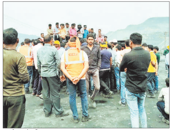
प्रदर्शन करते श्रमिक।