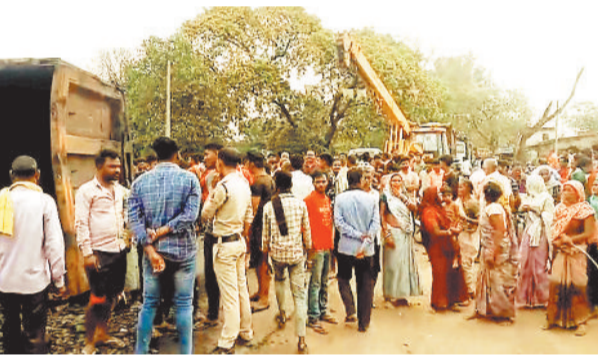
मौके पर उपस्थित ग्रामीणों की भीड़।