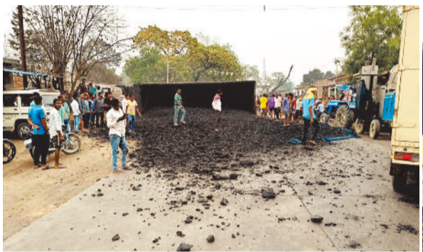
घटना स्थल पर पलटी ट्रेलर वाहन।